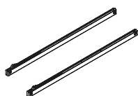
nr 47350000 komplet samodomykaczy AERO na 1 skrzydło do 60 kg soft-closer set